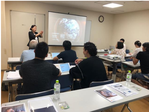
↑過去のセミナーの様子